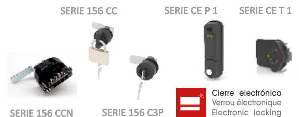
SERIE 156 CCN SERIE 156 C3P Cierre electrónico Verrou électronique Electronic locking