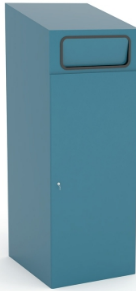
SERIE 160 1 TI