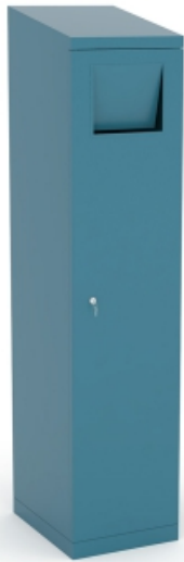
SERIE 160 0