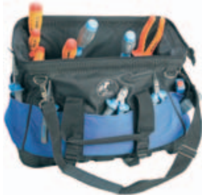
Gran espacio para más herramientas