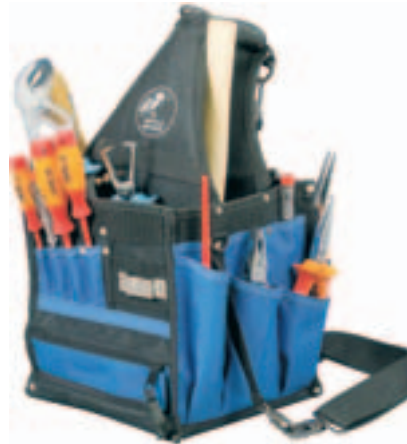
Caja de plástico para pequeños artículos