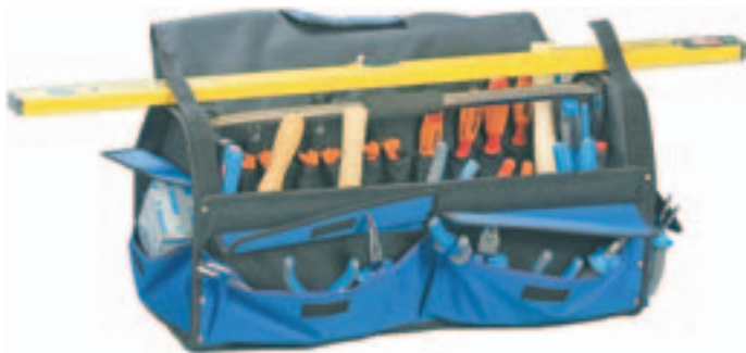
6 grandes Bolsillos alrededor